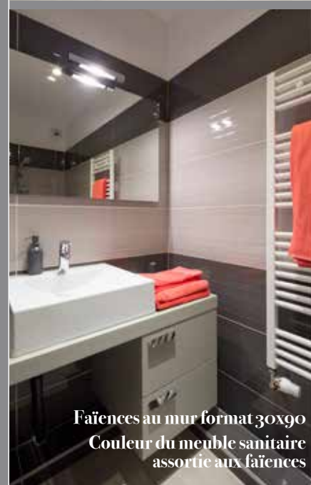
Faïences au mur format 30x90 Couleur du meuble sanitaire assortie aux faïences