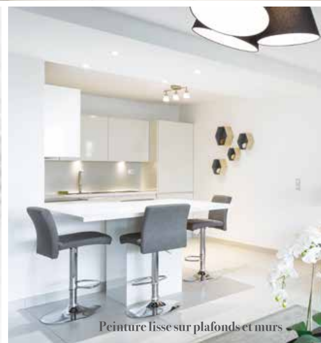
Peinture lisse sur plafonds et murs