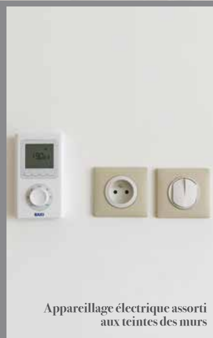
Appareillage électrique assorti aux teintes des murs