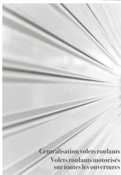
Centralisation volets roulants Volets roulants motorisés sur toutes les ouvertures