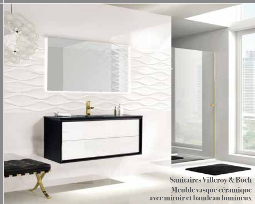
Sanitaires Villeroy & Boch Meuble vasque céramique avec miroir et bandeau lumineux

C'est la signature TDS, des appartements lumineux, des agencements fonctionnels, des prestations de qualité.