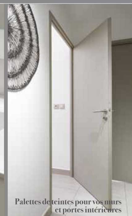
Palettes de teintes pour vos murs et portes intérieures