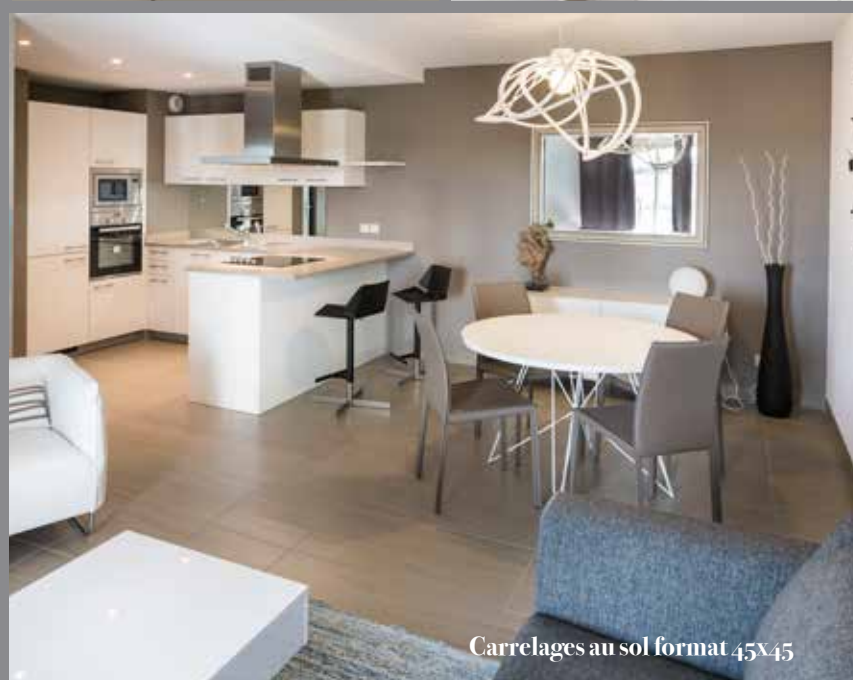
Carrelages au sol format 45x45