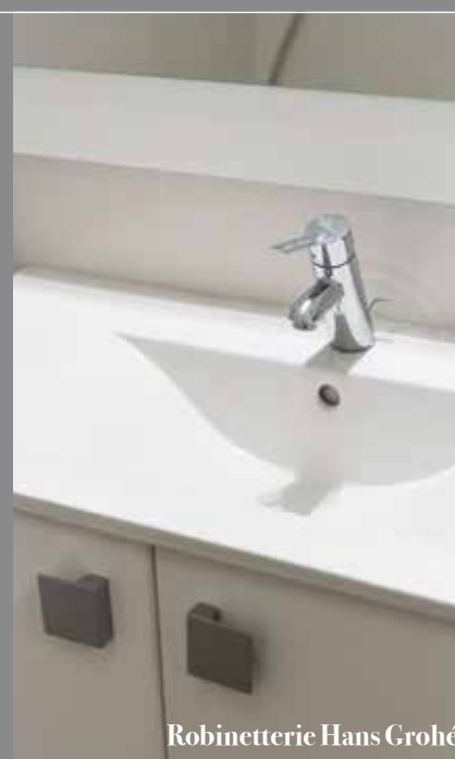
Robinetterie Hans Grohé