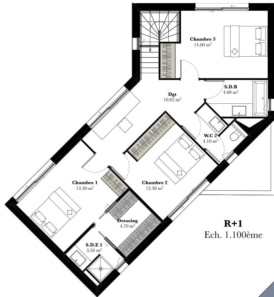
R+1 Ech. 1.100ème